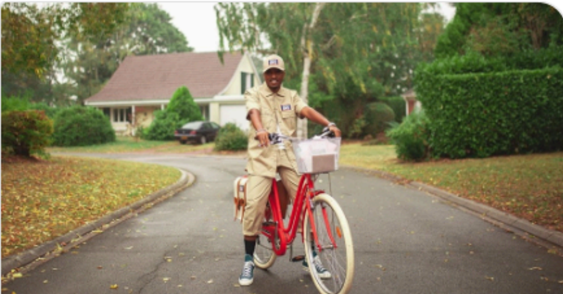
Soprano - À nos héros du quotidien (Clip officiel)

https://www.youtube.com/watch?v=fVuCviFkqNw&feature=share